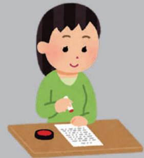
ハンコを押している人

それまでぼーっとしてハンコを受け入れていた私にとって、目からうろこが落ちるような話でした。考え方一つでハンコの新たな存在意義が見えたのです。廃止論も漂うハンコですが、せつかくあるからには慎重な判断を心がけるための手段として、活かしてみたいと思います。