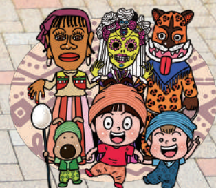
なんとみらいちゃん (スキヤキバージョン)