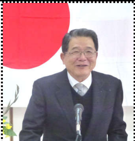
市議会議員 川口正城氏