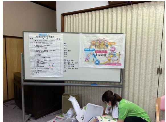
包括支援センターよりスタッフ派遣「フレイル」について勉強・実践しました