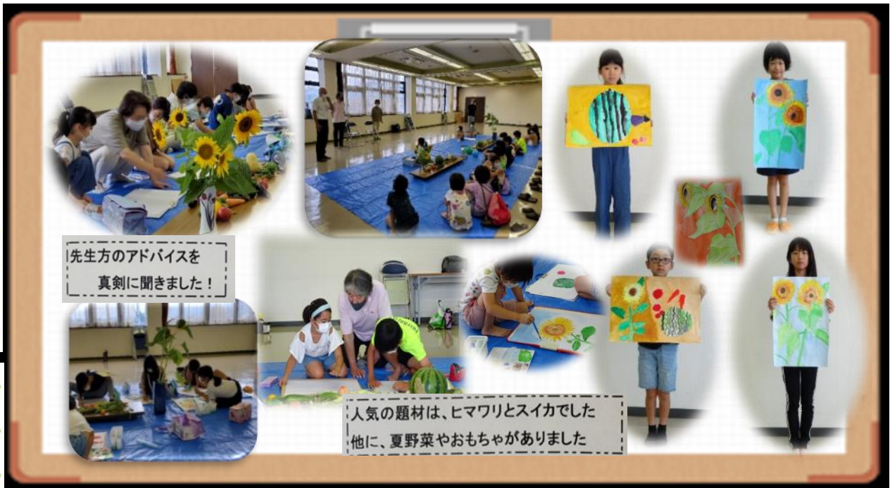
先生方のアドバイスを 真剣に聞きました!