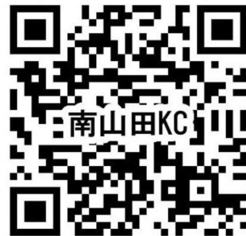
南山田地域づくり協議会ホームページ