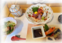
お楽しみの昼食は ルートイングランティア氷見で豪華和食ランチ