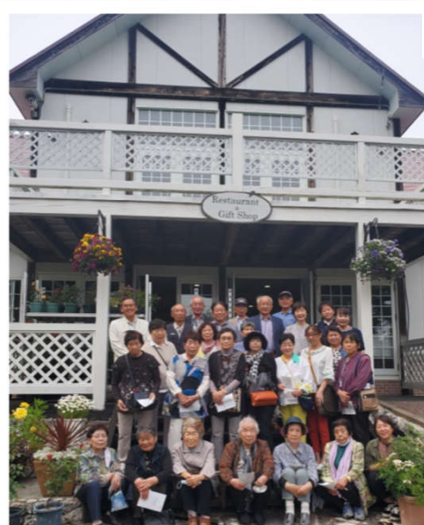
氷見あいやまガーデン エントランスにて