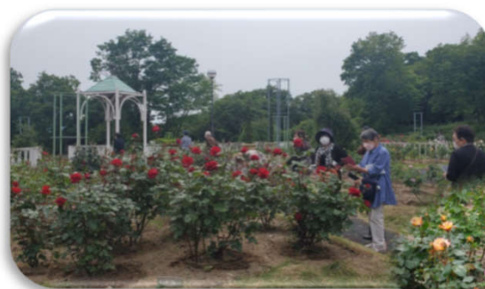
色とりどりの バラや花々に 癒されます🌹