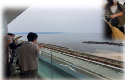
素晴らしい海の景観と ショップでお買い物