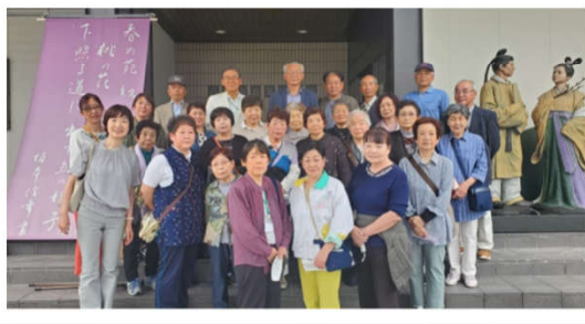
越中万葉の世界に触れてきました