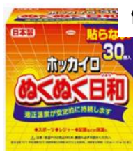
使いすてカイロ1箱