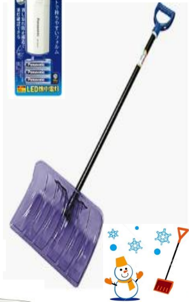
ラッセルスコップ