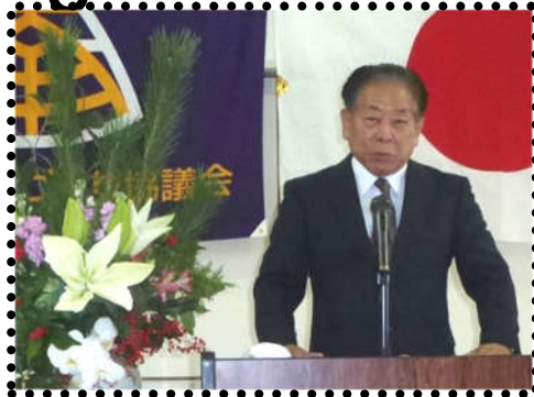
新春年賀の会 式次第