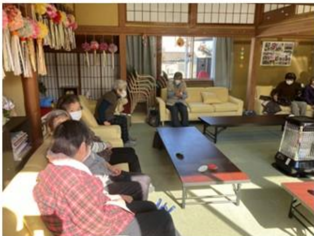
休憩・談話・仮眠室