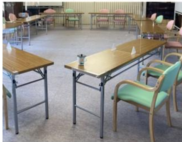
体操・ゲーム・イベント・食事室