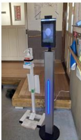
検温計と手指消毒