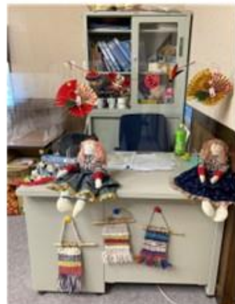
受付・健康チェック