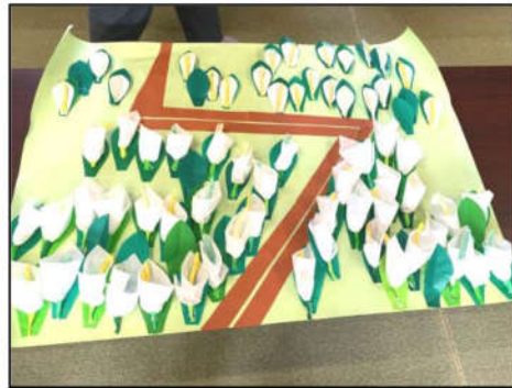
折り紙で作った水芭蕉