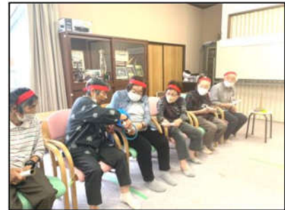
手先を使ったゲーム