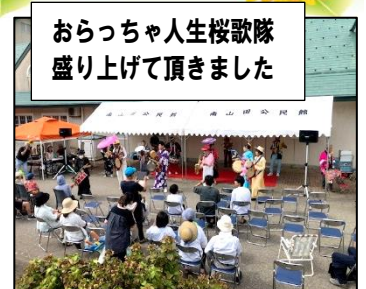
おらっちゃん桜歌隊 盛り上げて頂きました