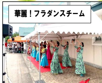
華麗!フラダンスチーム