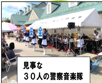
見事な 30人の警察音楽隊

ひまわりフェス実施 8/6(日) 猛暑の中、大盛況でした。 スタッフ・出演者の皆様、お疲れさまでした。